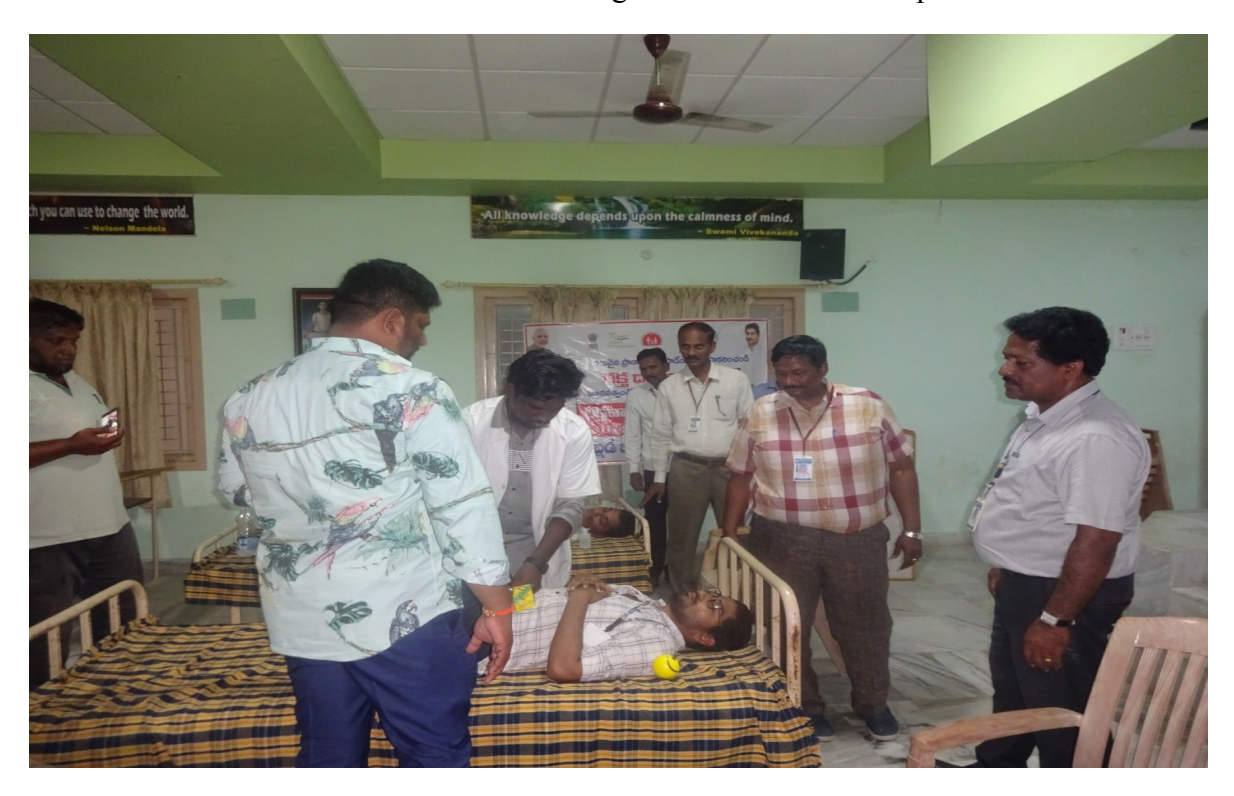
Principal, NSS PO Staff members and students at blood donation camp