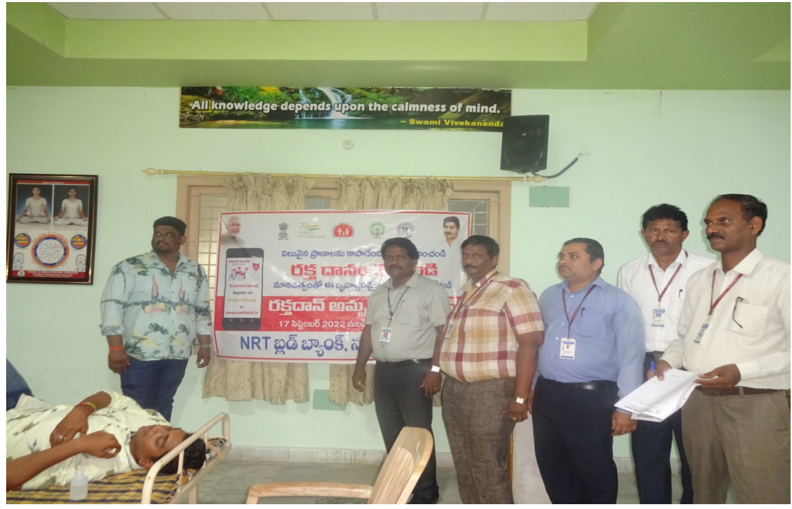
Principal, NSS PO Staff members and students at blood donation camp