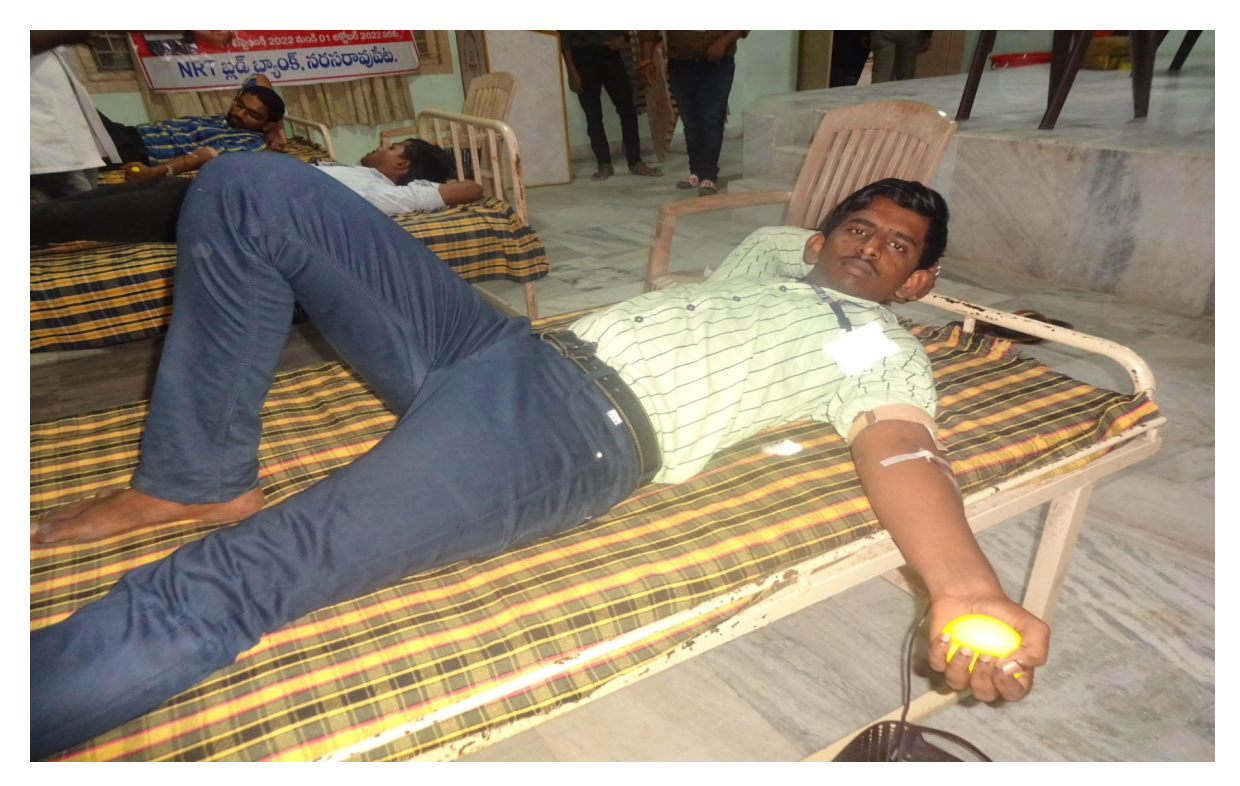
NSS Volunteers participating n blood donation camp