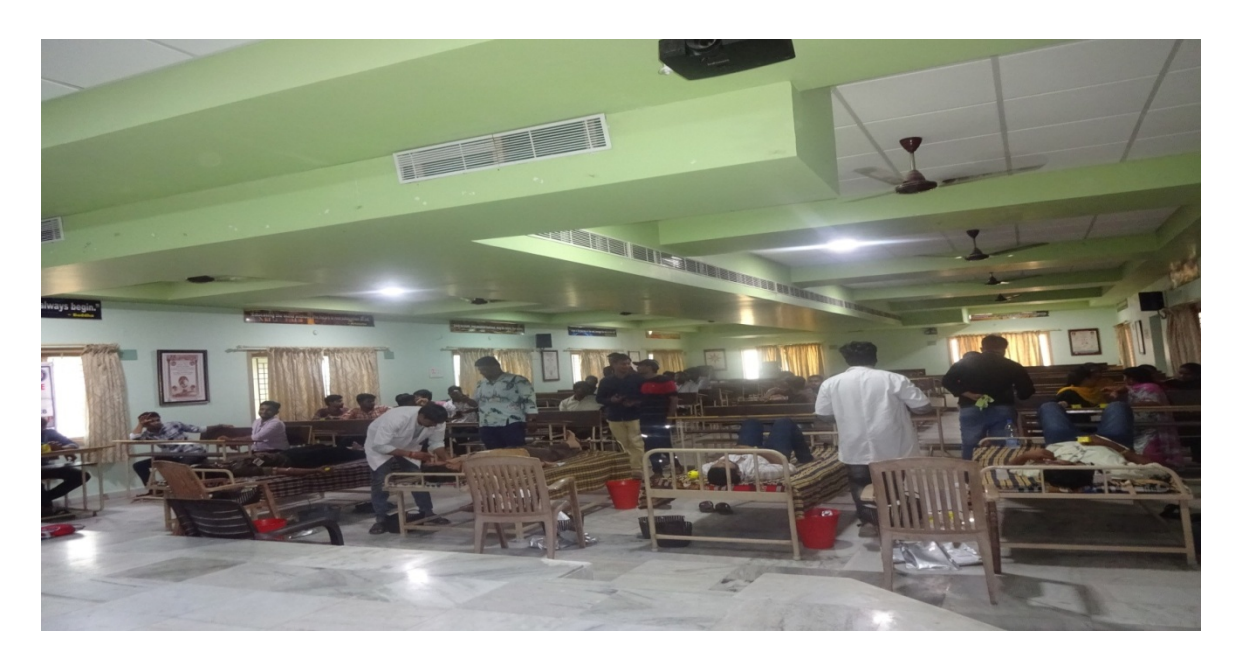
NSS Volunteers donating their blood in the camp