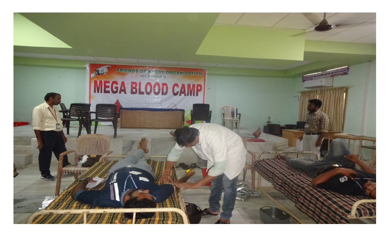
NSS Volunteers donating their blood in the camp