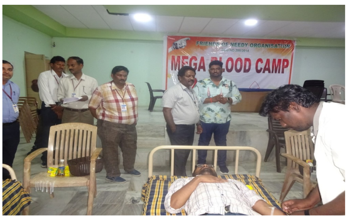
Principal, NSS PO Staff members and students at blood donation camp

Donation of blood is very critical and crucial for saving lives many patients and those who have met with accidents. It is as such a great service or contribution to the society and people living in it.